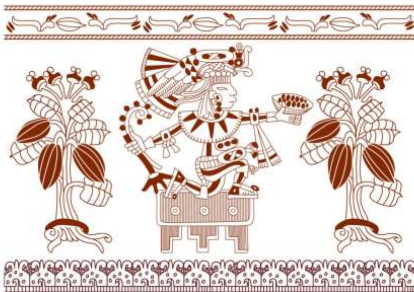
Prikaz rituala u veličanju zrna kaka

Čokolada je prirodan antidepresiv, sadržava triptofan koji stvara serotonin ili, kako ga zovu, hormon sreće.